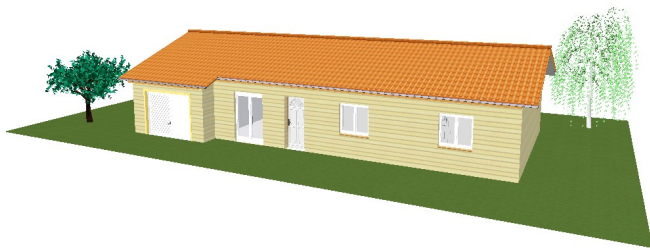
Modèle 90+15 Hors d'eau et hors d'air.