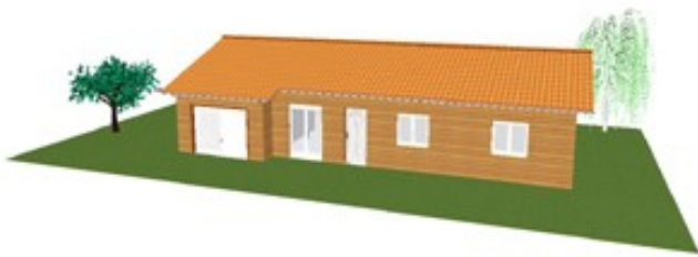
Modèle 80+15 Clés en main