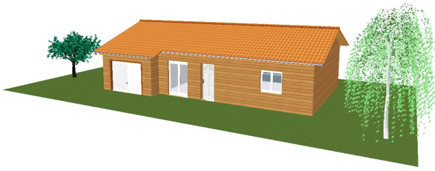
Modèle 70+15 Hors d'eau et hors d'air.