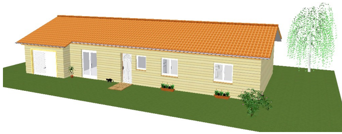
Modèle 100+15 Hors d'eau et hors d'air.